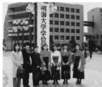
記念写真を撮る卒業生たち