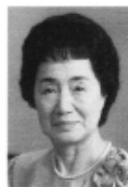
明海大学教授 東北農科大学名誉教授 (財)21世紀福寿財団 会長